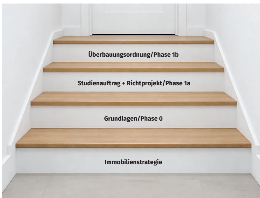
Planungshorizont über mehrere Jahre hinweg