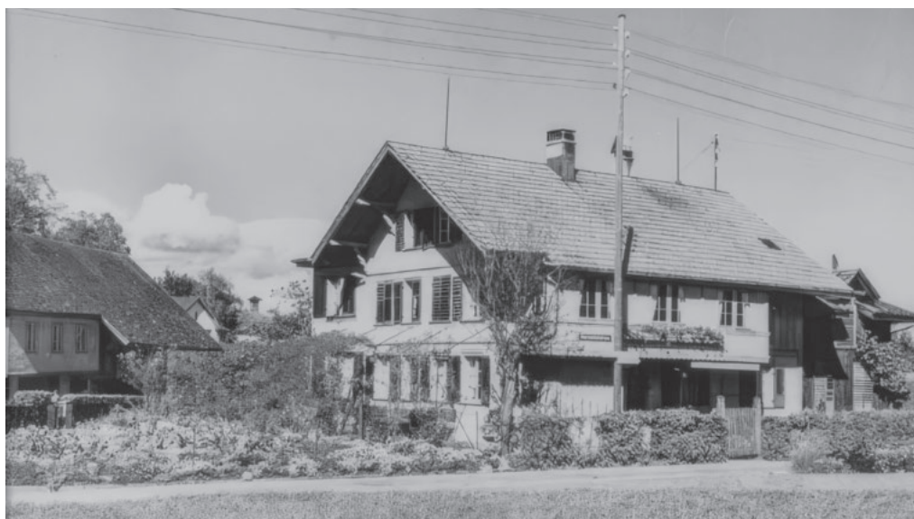
Westansicht des Haslibrunnen im Jahr 1950

«profil» 5-26 steckt am 10. September in jedem Briefkasten.