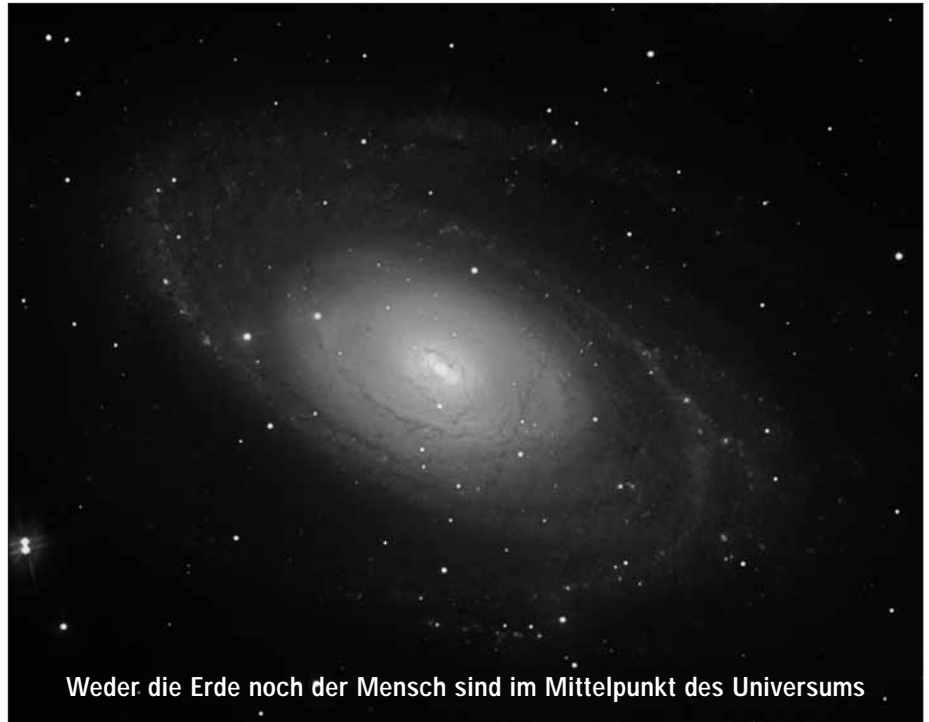
Weder die Erde noch der Mensch sind im Mittelpunkt des Universums

Wer sich jetzt – wie die Katharer – «ketzerisch» verhält, indem er rein und ohne Sünde sein will, fällt paradoxerweise aber gerade selbst in eine Sündenfalle hinein, nämlich in die des «Ich bin besser als die