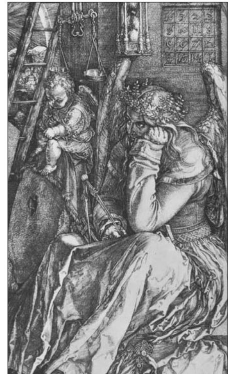
«Melancholia», von Albrecht Dürer mit magischem Quadrat (oben rechts, siehe auch S. 5)

Ganz Ähnliches gilt für die Zahl Zehn. Sie hat vor allem den Charakter von Ordnung, Vollendung und Ganzheit. Wir erinnern uns vor allem des Dekaloges, der Zehn Gebote als einer ganzheitlichen ethischen Vorgabe. (wivi)