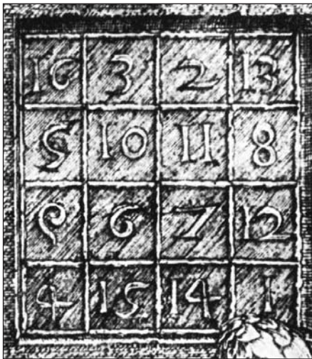
Kupferstich aus dem Jahre 1514 (A.D)

Magische Quadrate im klassischen Sinn liegen vor, wenn nicht lateinische Buchstaben, sondern Zahlen eingesetzt werden, und wenn anstelle der zusätzlichen griechischen Buchstaben die Bedingung erfüllt sein muss, dass sich in jeder Spalte und in jeder Zeile die gleiche Summe ergibt. Die berühmteste Darstellung eines solchen magischen Quadrates finden wir bei Albrecht Dürer in seinem Bild «Melancholie».